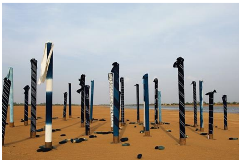
Une installation d'Aboubakar Fofana sur les bords du fleuve Niger